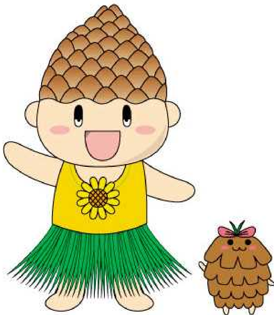
煙樹ヶ浜松林イメージキャラクター まつりん & ぽっくりん