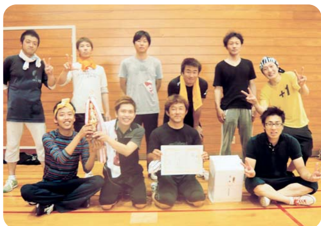
優勝 上田井スポーツクラブ