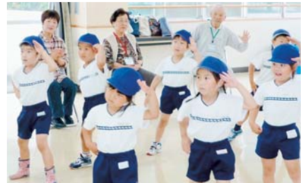
まつりん&ぼっくりん体操