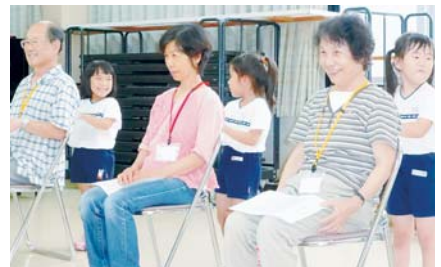
かまきりマッサージ