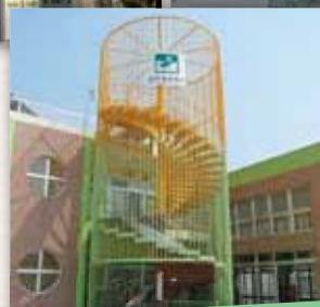
和田小・松原小・ひまわりこども園屋上避難用外階段