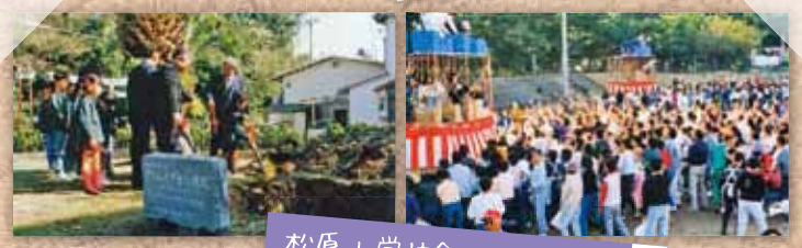
松原小学校創立100周年