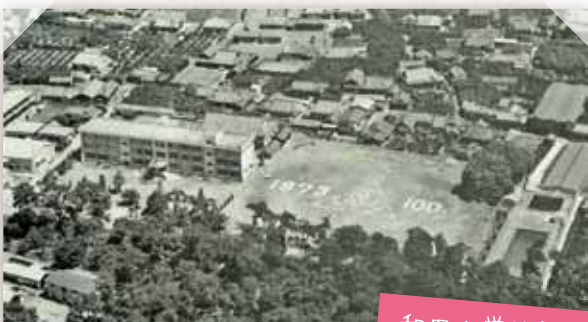
和田小学校創立 100 周年