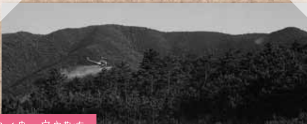
マツクイ虫・空中散布