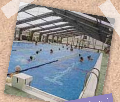
海洋センター(B&Gプール)