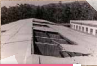
第2室戸台風被害・和田小旧校舎、松洋中旧校舎