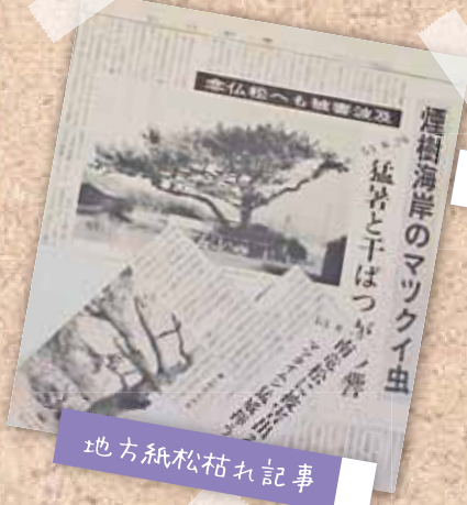
地方紙松枯れ記事