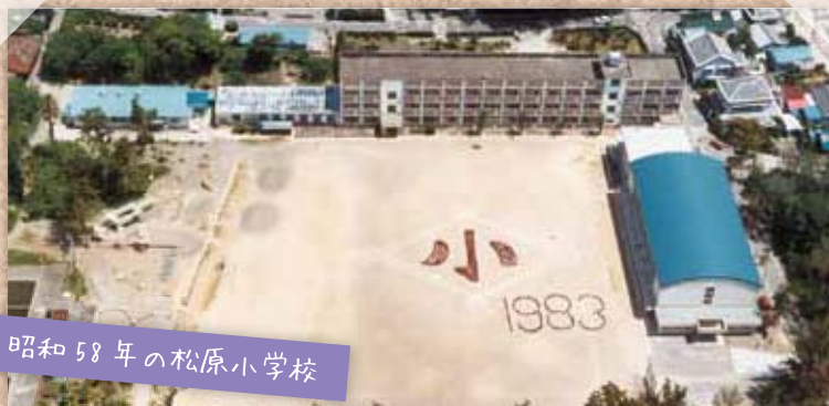
昭和58年の松原小学校