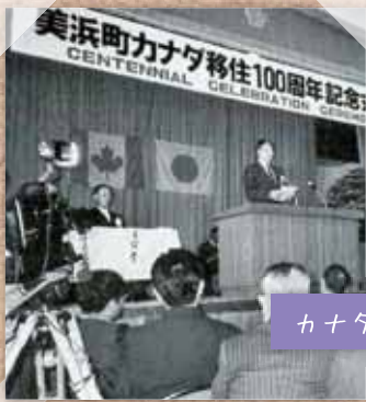
カナダ移住100周年記念