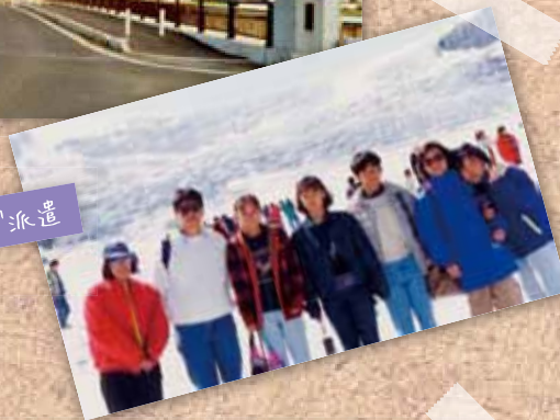
青少年カナダ派遣