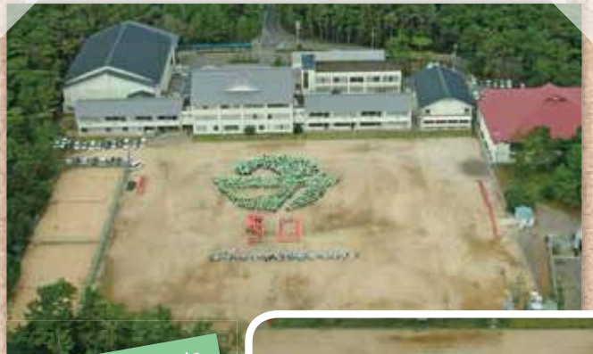
町制施行 50 周年