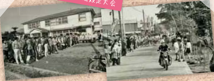
成人式祝賀駅伝競走大会