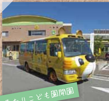
ひまわりこども園開園