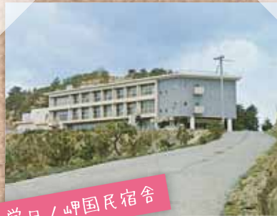
町営日ノ岬国民宿舎