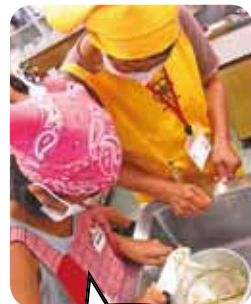
ごぼうのささがきに挑戦!