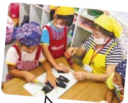
包丁を使って 材料を切ったよ