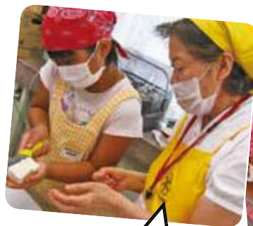
豆腐は手の上で切ります お見事♪