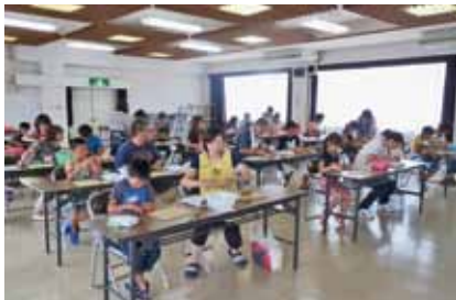
親子で挑戦！シーサー作り陶芸教室