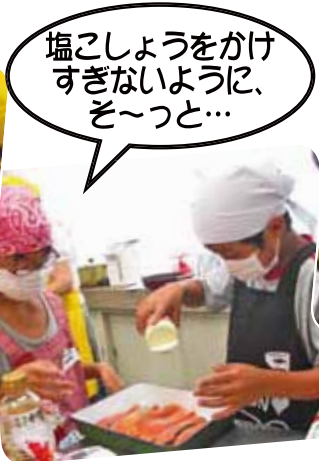
塩こしょうをかけ すぎないように、 そ〜っと…