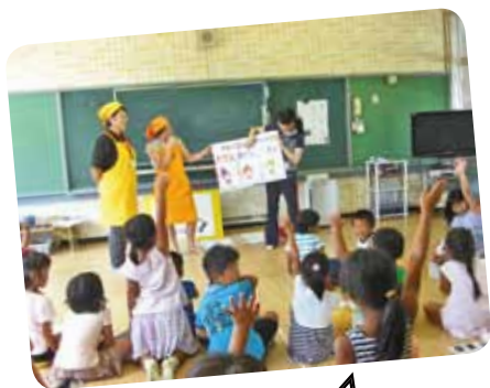
野菜について お勉強!