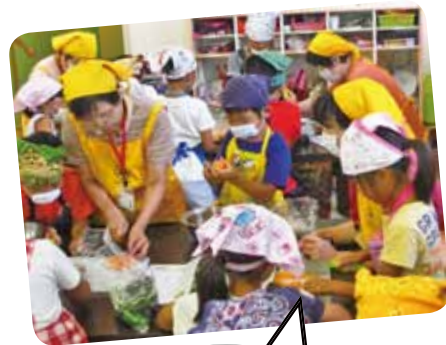
たまねぎが 目にしみる~! みんな涙がポロポロ