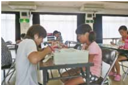
一緒に絵を描こう！教室