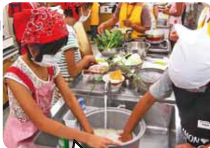
お米を洗って炊きます

一般公募により参加した 16 名の子どもたちが、鮭のムニエル・ひじきの煮物・青菜のお浸し・貝たくさん味噌汁の4品を作り、ご飯の炊き方やだしを取り方など料理の基本を学びました。