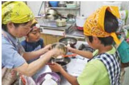
お菓子(沖縄ドーナツ)作り教室