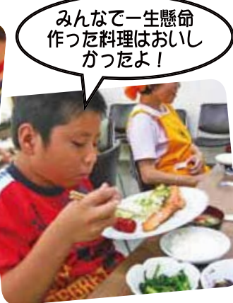
みんなで一生懸命 作った料理はおいし かったよ!