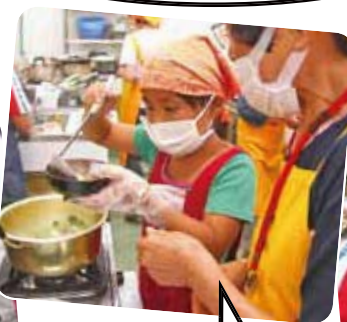
盛りつけも 自分たちでします