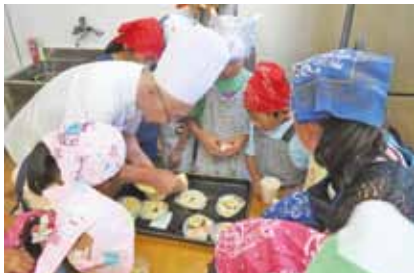
夏休み子どもパン教室