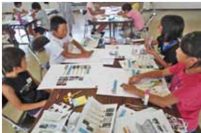
みんなでまなぼうさい！教室