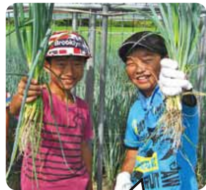
ねぎを収穫したよ!