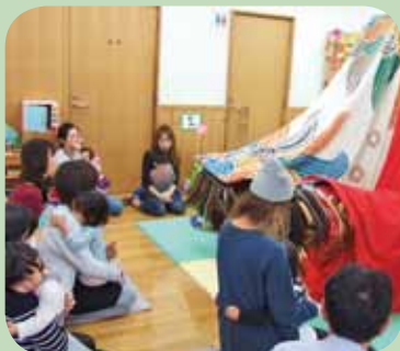
『 獅子舞を見よう! 』 地元の獅子舞を見せてもらいました。 怖くて泣いちゃったよ!