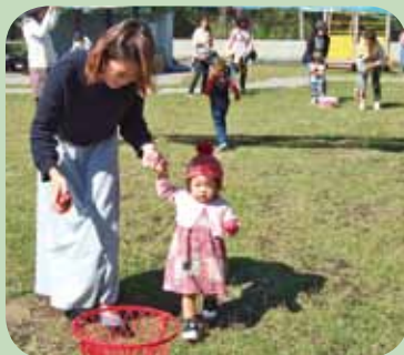
『 広場で遊ぼう (煙樹海岸多目的広場)』 かけっこや玉入れをしたり、砂場で遊んだりしました。