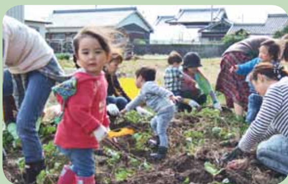
『 芋掘り(1・2歳児) 』 ツルを引っ張ったりスコップで掘ったりすると、 大きなお芋が出てきたよ。