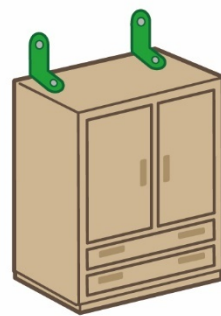
L型金具 (上向き取付け)