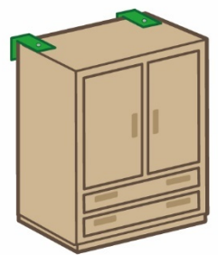
L型金具 (下向き取付け)