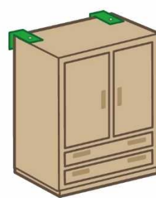
L型金具 (下向き取付け)