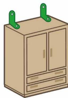
L型金具 (上向き取付け)