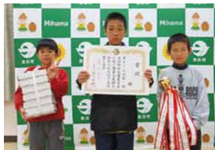
▲ 短縮の部・小学生優勝