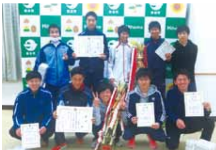
▲ 一般・学生の部優勝