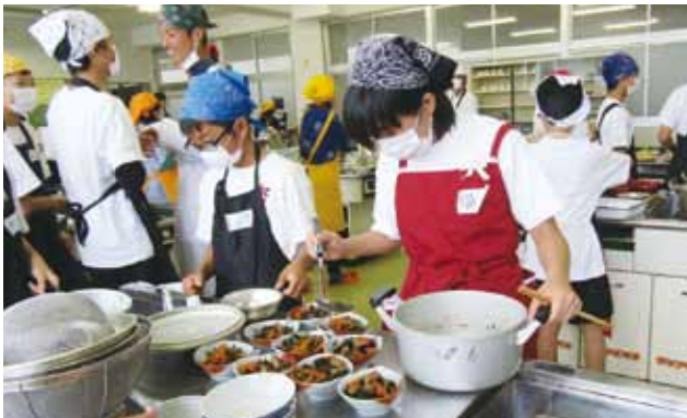
盛り付けもきれいに♪