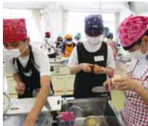
手を切らないように注意しよう