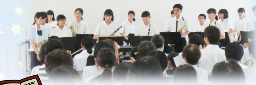
七タコンサート 演奏：松洋中学校吹奏楽部