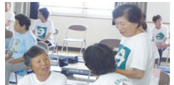
▲休憩に楽しくおしゃべり