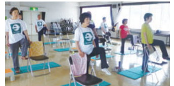
▲筋肉トレーニング