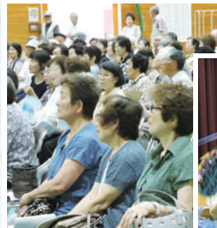
各応援団など、 会場にはたくさんの 観客が集まりました