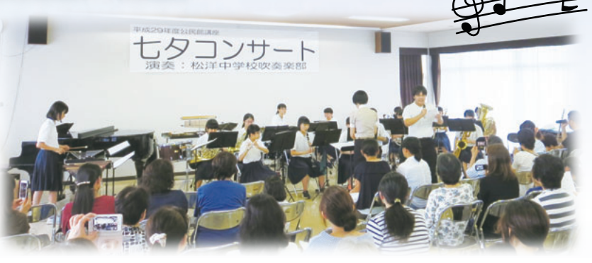
平成29年度公民館講座 七タコンサート 演奏：松洋中学校吹奏楽部