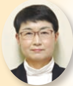
龍神 初美 議員