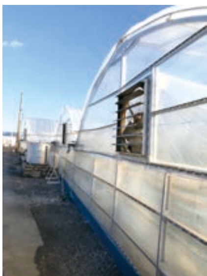
▲ 電動シャッター式換気扇

町としても、意欲ある生産者の皆様のニーズを的確に把握し、施策に反映していかなければならないと考えている。 「低コストハウス等における換気扇や吸気口である電動シャッターの交換」に対する補助事業の創設に関しては、新年度からの制度化に向け、調査研究していく。