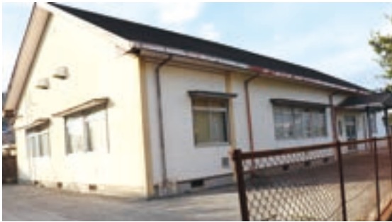
▲ 解体予定の旧武道館