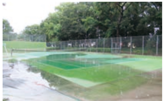
▲ 雨水のたまったテニスコート