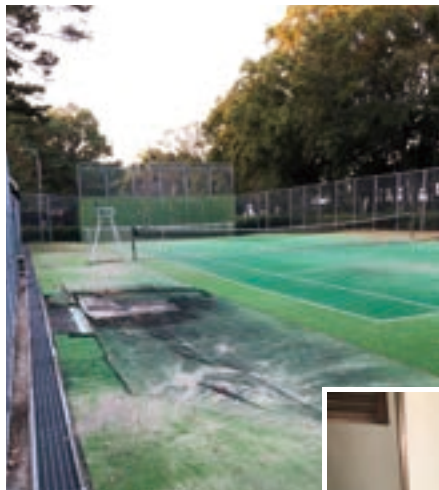
▲ トイレ・テニスコートの現状