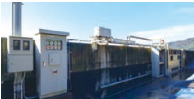
▲ 使用されている電動式の陸間