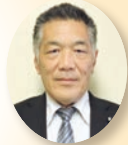
碓井 啓介 議員