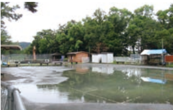
▲ 雨水のたまったゲートボール場