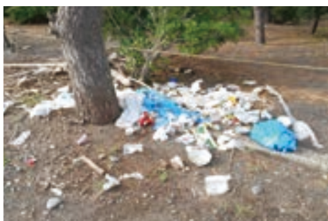
▲ ごく一部のキャンプ客ではあるが

キャンプ場の閉鎖を看板などで周知し、松林内で焚火をする事などにも留意して、警察に巡回依頼をした。