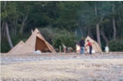
▲ 閉鎖中なのに・・・

町長 けっして開設したくないわけではなく、このコロナ禍で管理をしてくれる方が見つからなかった。