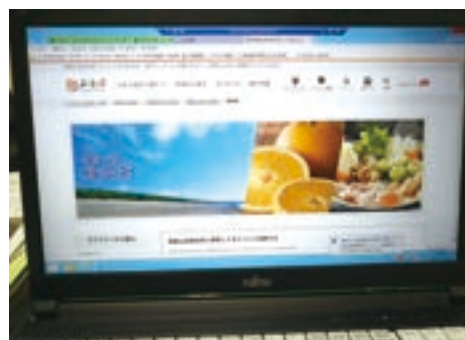
▲ ふるさと納税ホームページ