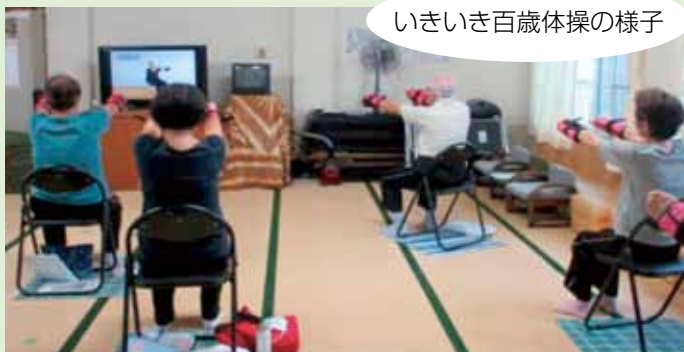
いきいき百歳体操の様子