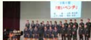
3年1組・青いベンチ