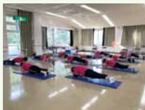
腰痛膝痛予防サークル