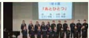
1年2組・あとひとつ