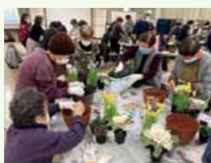
認知症予防サークル