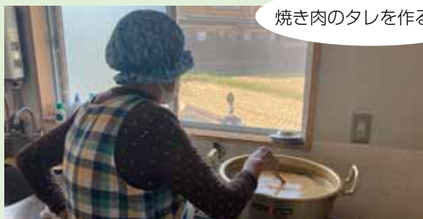
焼き肉のタレを作る様子