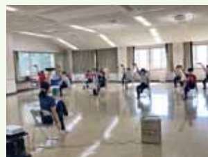
元気はつらつ教室