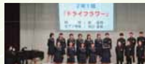
2年1組・ドライフラワー