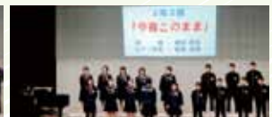
2年2組・今夜このまま