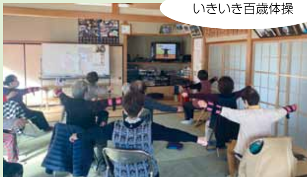
いきいき百歳体操