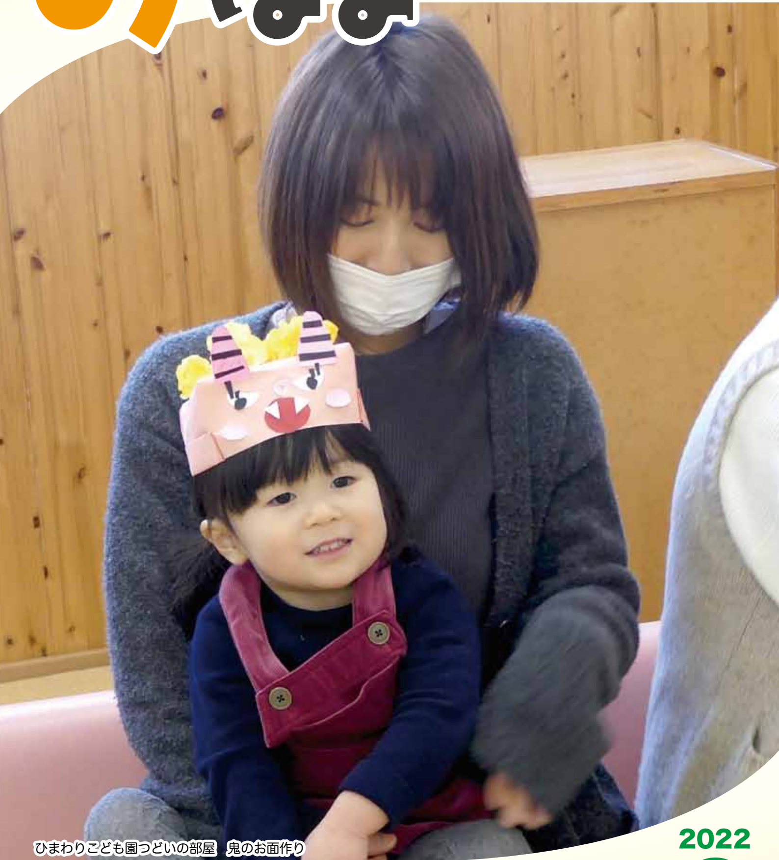
ひまわりこども園つどいの部屋 鬼のお面作り